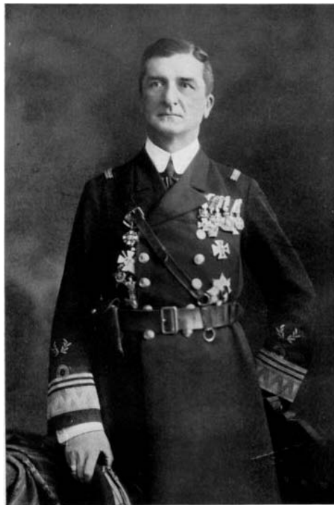
Horthy Miklós tengernagy

kok bujkáltak. A nyitott ablak kiverődő világosságában pedig levet kalappal szomszédok álltak. Ők is imádkoztak.