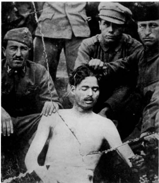
A Lenin-fiúk egyik áldozatukkal fényképeztetik magukat

egyedül maradtam, megkíséreltem, fel tudék-e könyökölni a párnán. Két nap múlva utaznom kell. Visszaestem.