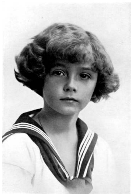
Ottó koronaherceg - Magyarország törvény szerinti királya

– Éljen a forradalom, éljen a spritzer... Lealázóan undorító volt az egész. Menekülni szerettem volna, hogy ne lássak, ne halljak semmit. Haza vágyódtam. Haza, a hűvösvölgyi házba, az erdők fölött, a hegyek közé.