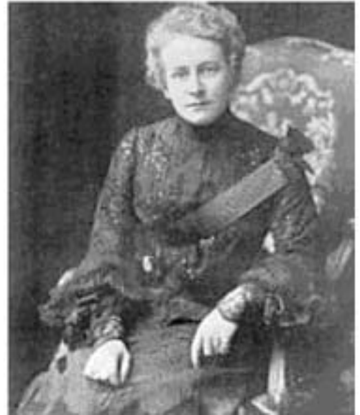
Tormay Cécile (1876-1937)