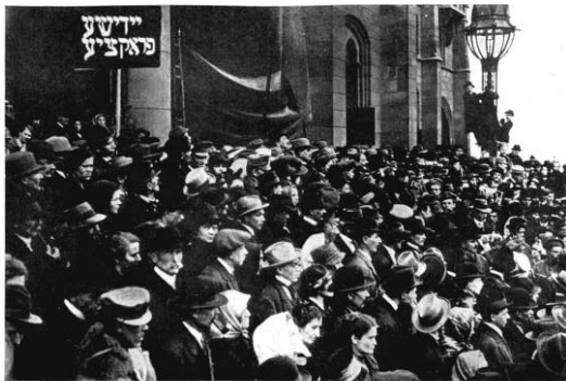
Zsidók-szervezte gyűlés, ahol a vörös gárda felállítását határozták el.

csot, ellopják az élelmiszerüket, még a bicskájukat is. Éhesen, dühösen jönnek haza és követelődznek.