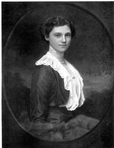
Chata Kozel, Viena.

séggel feslik egyik szem a másik után. Feltarthatatlanul bomlik az ezeréves szöttes.