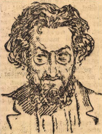
Schreider, az orosz sajtóbírótság elnöke.