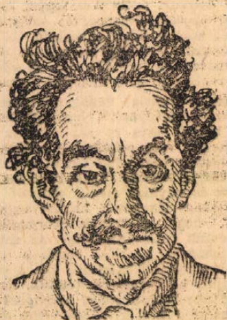
Petrow-Waisbrod, orosz „diplomata” a breszlitowszki békotárgyaláson.