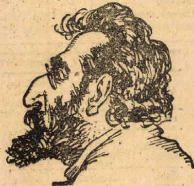
Martow-Lederbaum, a munkástanácsok végrehajtó- bizottságának tagja.