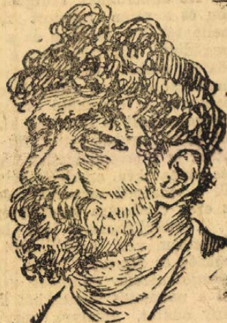
Jarovszky Jankel, a cári család gyilkosa.