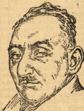
Vigdor Kopp, volt berlini szovjet-követ.