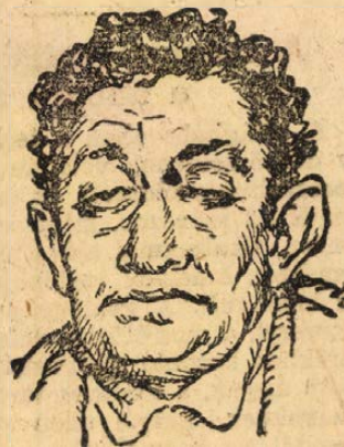
Sinowjew-Äpfelbaum, pétervári kormányzó.