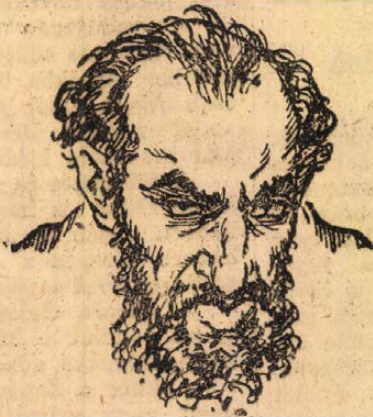
Stechlow-Nachamkes, az orosz sajtó népbiztosa.