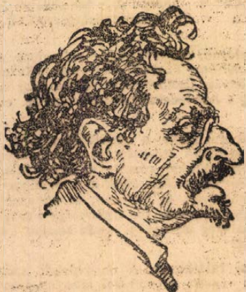
Trotsky-Braunstein Leó, hadügyi és tengerészeti népbiztos.