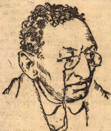
Uritsky Mózes, az ellenforradalom leverését vezető népbiztos, „Pétervár hóhérja”.