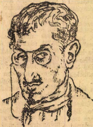
Proschian földművelésügyi népbiztos.