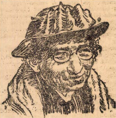
Goldmann Emma, az orosz Luxemburg Róza.